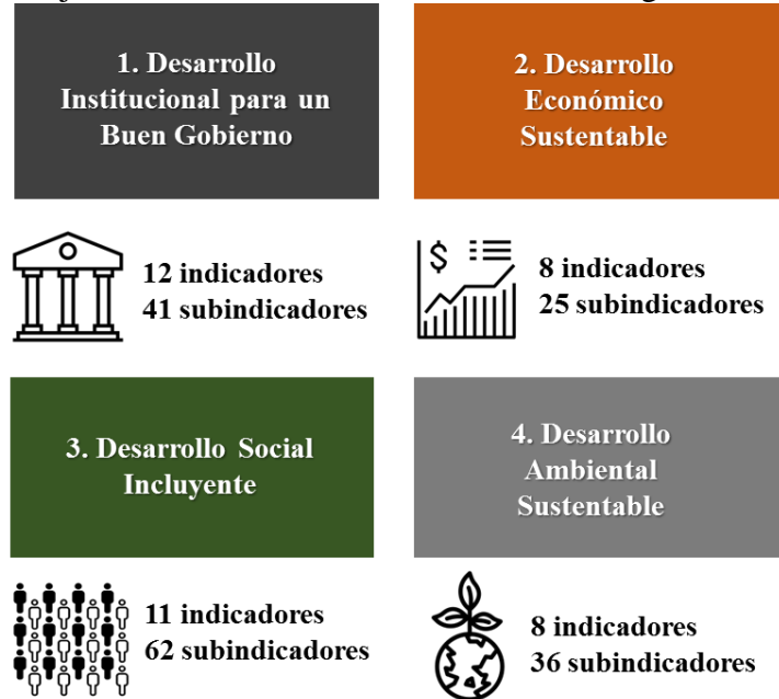
Figura 1. Ejes e indicadores de la Herramienta de Seguimiento Distrital