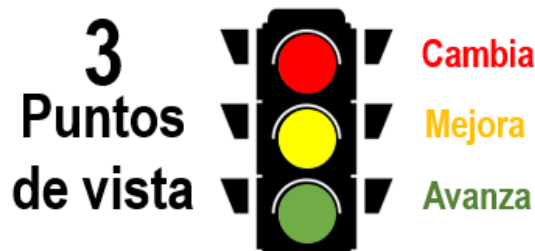
Figura 2. SemafORIZACIÓN de la Herramienta de Seguimiento Distrital